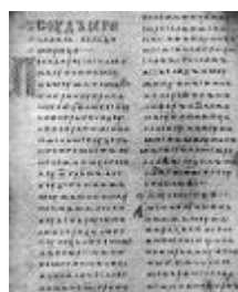
Двинская уставная грамота

Лихоимец – жадный вымогатель, взяточник».