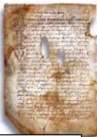
Псковская судная грамота

Уложение 1649 года. Следует заметить, что уголовное право в XVII веке развивалось в условиях резкого обострения классовых противоречий. Заметным стимулом его развития, расширения круга деяний, подлежащих уголовному преследованию, появлению новых видов преступлений, послужили события начала XVII века и восстания 30–40-х годов XVII века. Ко времени Алексея Михайловича Романова относится практически единственный народный бунт антикоррупционной направленности. Он произошёл в Москве в 1648 году и закончился победой москвичей: царём были